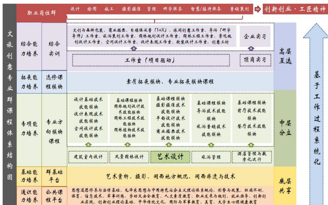
图 2 文旅创意专业群课程体系结构图

展模块+素质拓展模块”的模块化课程体系，其中专业方向课模块以培养岗位领域核心能力为目的构建并融入“岗课赛证”的几项专业技术技能课程模块。实行“专业进、专业群培养、专业出”个性化人才培养。